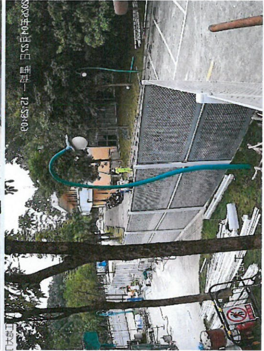
2022年04月22日 星期一 12:53:03

监理单位：上海申通地铁集团工程咨询有限公司 建设单位：上海申通地铁集团工程咨询有限公司 监理单位：上海申通地铁集团工程咨询有限公司 监理单位：上海申通地铁集团工程咨询有限公司 监理单位：上海申通地铁集团工程咨询有限公司 监理单位：上海申通地铁集团工程咨询有限公司