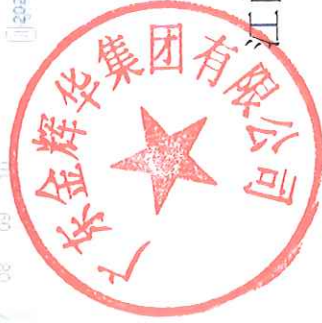
江门市智慧工地监管平台扬尘在线监测截图